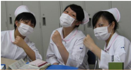
病院内でのオリエンテーション

6月4日から2週間、今回は内科・外科・整形外科・脳外科・小児科・透析・リハビリなど外来の看護を学ぶ目的で落合病院・金田病院で実習中です。